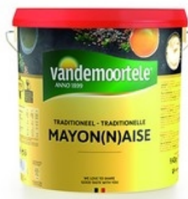
VANDEMOORTELE Mayonaise traditionnelle Mayonnaise traditionnelle 10 L