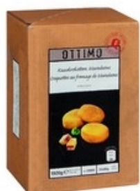
OTTIMO Krokot met Maredsousabdijkaas Croquette au fromage d'abbaye Maredsous 24x80 g