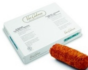
VAN GELOVEN Meester garnalenkroketten Croquette de Maître aux crevettes 20x80 g