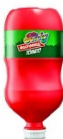
BICKY Tomato bomber 2,7 kg