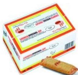
MORA Loempia speciaal kip Loempia spécial poulet 12x175 g