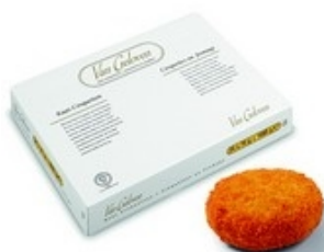
VAN GELOVEN Meester kaaskroket Croquette de Maître au fromage 24x70 g