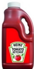
HEINZ Tomato ketchup 4 L