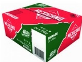
BICKY Mexicano burger 24x135 g