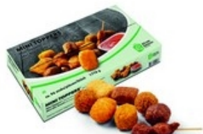
AD VAN GELOVEN Mini toppers 96 st/pcs