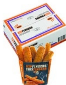
MORA Kipfingers Chixfingers 120x16 g