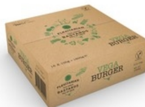
FLEXITARIAN BASTARDS Bastard vega burger 16x100 g