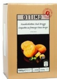
OTTIMO Kaaskroketten Oud-Brugge Croquettes au fromage Vieux-Bruges 24x65 g